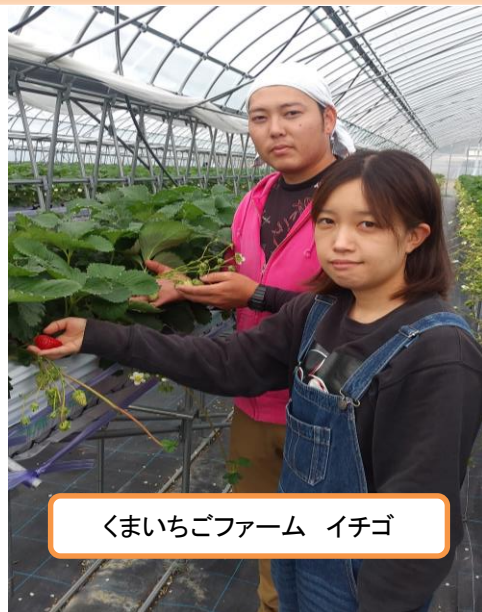
くまいちごファーム イチゴ