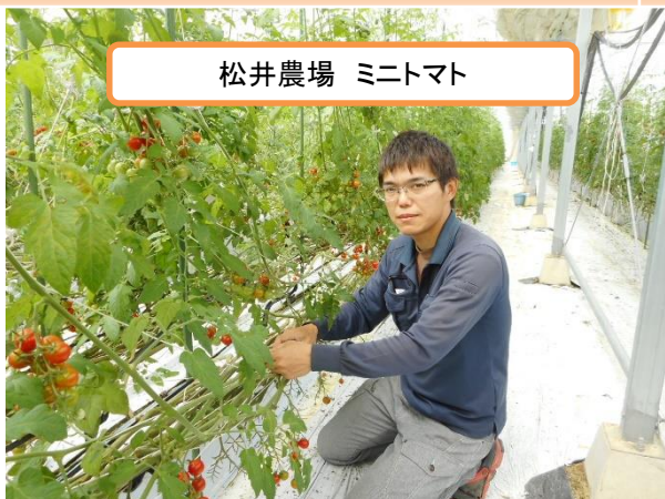
松井農場 ミニトマト